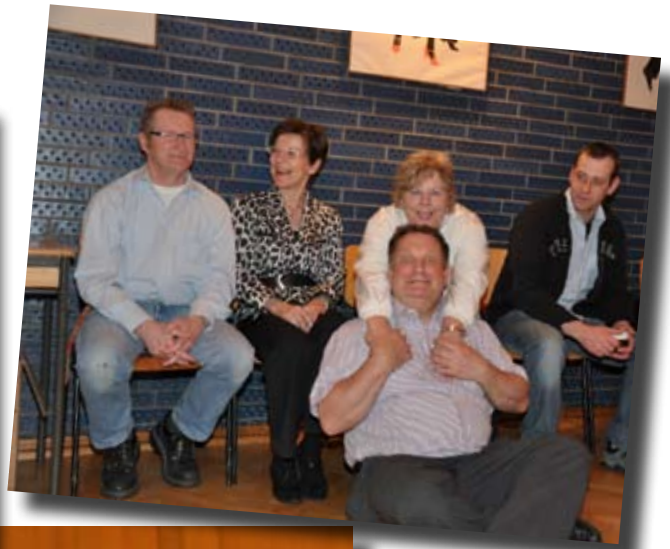
Schnappschüsse von Andreas Federwitz