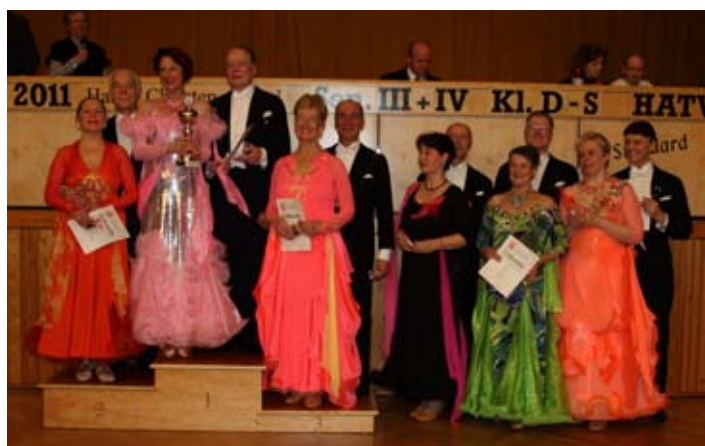
Siegerehrung der Sen. IV S

>> Die Turnierergebnisse online auf www.clubsaltatio.de > Turnier-Infos