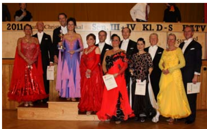
Siegerehrung der Sen. III S