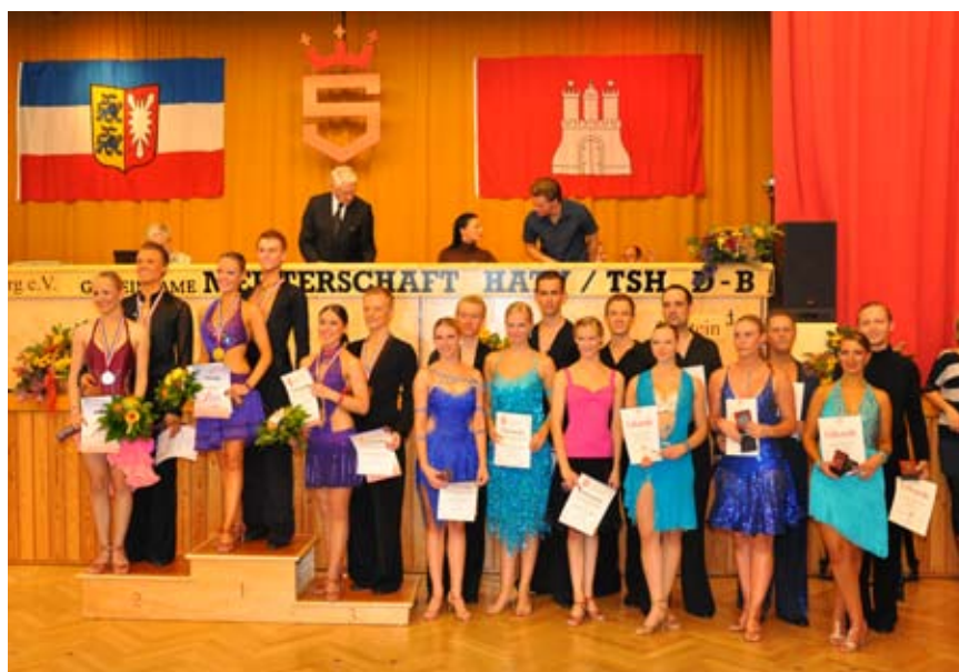
Siegerehrung der Hauptgruppe D Latein