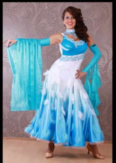
MADE WITH SWAROVSKI® ELEMENTS NEU 899€