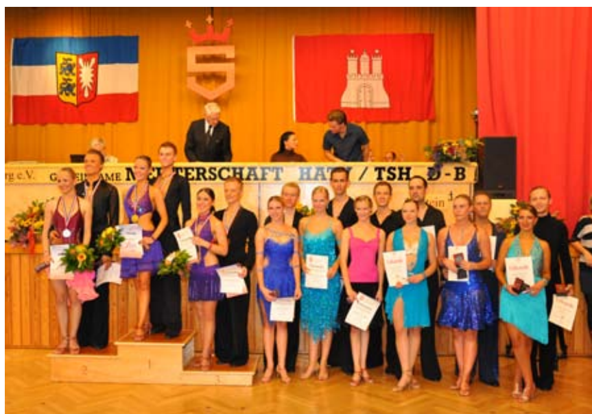
Siegerehrung der Hauptgruppe C Latein