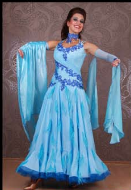
MADE WITH SWAROVSKI® ELEMENTS NEU 899€