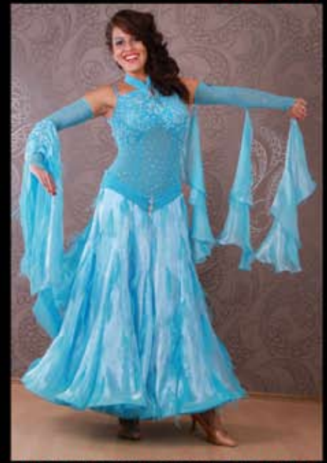
MADE WITH SWAROVSKI® ELEMENTS NEU 899€