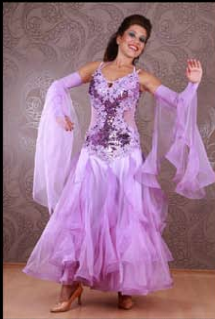
MADE WITH SWAROVSKI® ELEMENTS NEU 1000€