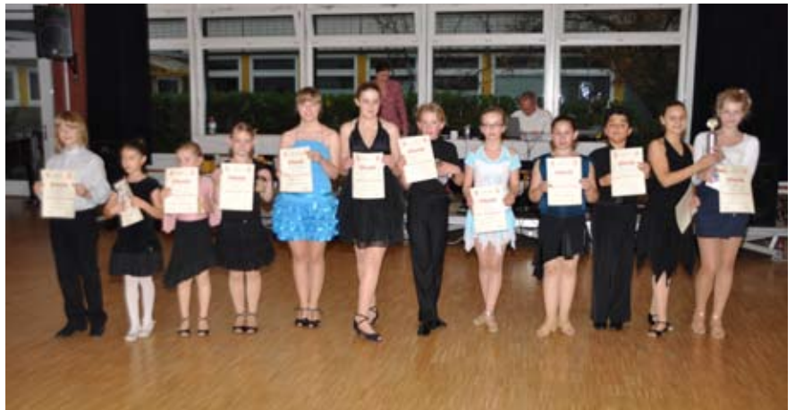
Die Tänzer um den Viola-Gummlich-Pokal: A-Finale oben, B-Finale unten.

An die Kleinen, die noch nicht so lange tanzen, wurde übrigens auch gedacht: Die Jugendwartin